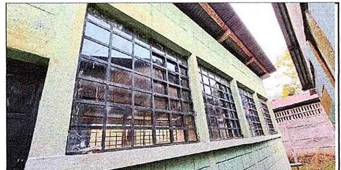
Foto 6: APLICACIÓN DE PINTURA Y SUSTITUCION DE ESTRUCTURA DE TECHO.

Observación: Si es necesario se pueden agregar hojas adicionales y actualizar el número de hojas.