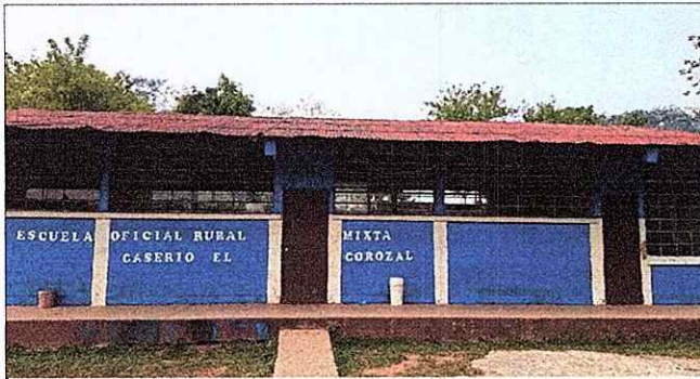
Foto1: MANTENIMIENTO Y SUSTITUCION DE CUBIERTA DE LAMINAS